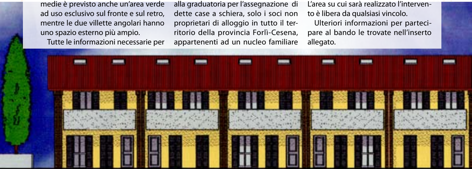
PROSPETTO LATO STRADA

Ulteriori informazioni per partecipare al bando le trovate nell'insero allegato.